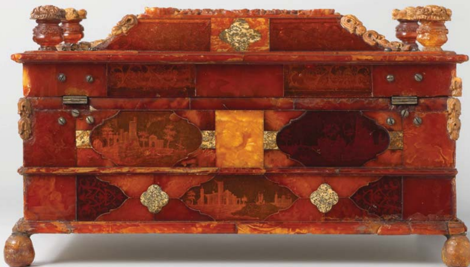
Speeldoos met vier kleine dozen Circa 1734. Vermoedelijk Gdansk (Danzig), Polen