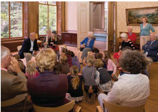
Grootoudergezelschap Bijeenkomst in het Bijbels Museum

Grootoudergezelschap opgericht dat inmiddels bestaat uit achttien enthousiaste grootouders, die gedurende tenminste vijf jaar 500 euro betalen waarmee zijzelf én hun kleinkinderen lid zijn. Met dit lidmaatschap en twee jaarlijkse ontvangsten voor grootouders met hun jonge familie helpt de grijze generatie om bij de jeugd een kiem te leggen voor interesse in alle mooie kunst die Nederlandse musea te bieden hebben. Op 2 mei was het gezelschap te gast bij de kindertentoonstelling MegaGrieken in het Rijksmuseum van Oudheden in Leiden. En op 21 november werd een ontvangst georganiseerd in het Mauritshuis, waarin de grootouders 'les' kregen hoe met hun kleinkinderen naar kunst te kijken.