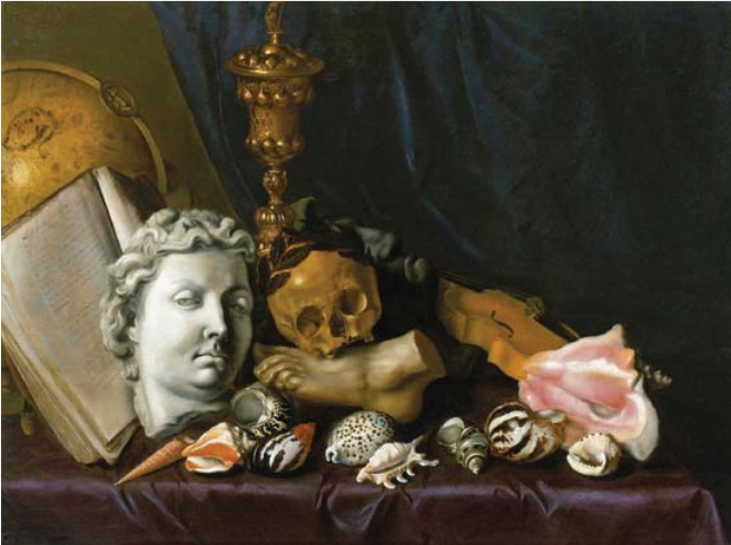
Vanitas stilleven Ca 1650. Dirck de Horn

Twenthe op de tweede plaats met 266 stemmen. Als nummer één met 326 stemmen is gekozen voor de aankoop van Vanitas stilleven van De Horn voor het Fries Museum.