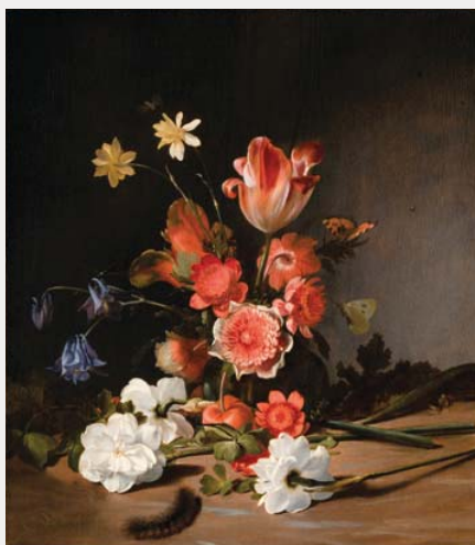
Stilleven van een boeket in wording 1674. Dirck de Braay