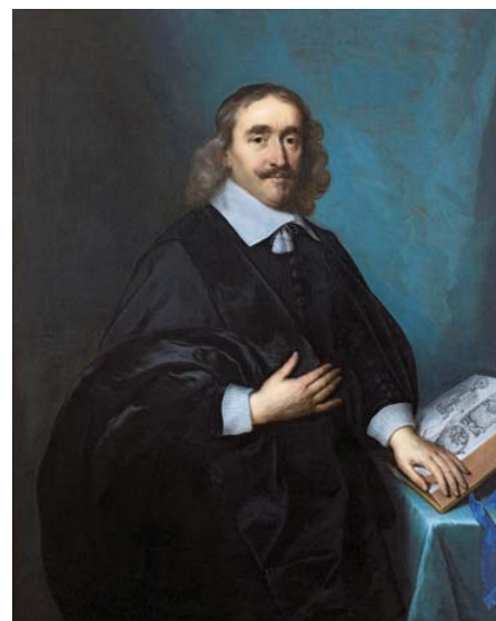
Portret van IJsbrand van Diemberbroeck 1657. Cornelis Jonson van Ceulen I