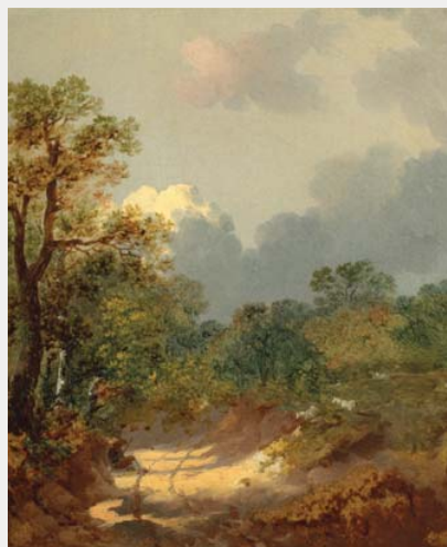
Boomachtig landschap met een rustende herder bij een zonnig pad en schapen. Ca 1646. Thomas Gainsborough