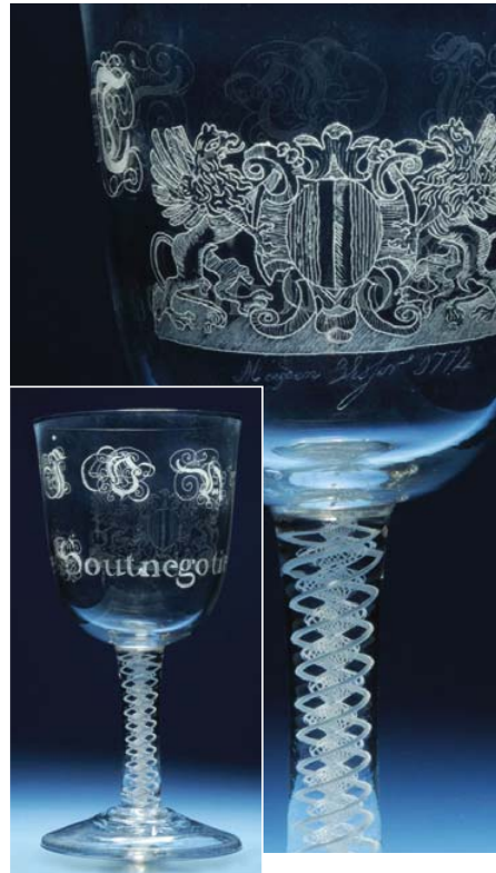
Gegraveerd glas 'Vivat Houtnegotie' 1772. Glas: Nederlanden, Graving: Meyden Visser