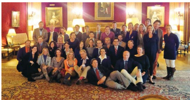
De Titus Cirkel organiseerde in 2010 een driedaags bezoek aan Parijs, ter gelegenheid van de 15de editie van 'Paris Photo'.

De leden van de Vereniging Rembrandt konden via de site opgeven welk verzamelgebied hun bijzondere