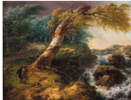
Landschap in de storm 1804. Gerard van Nijmegen