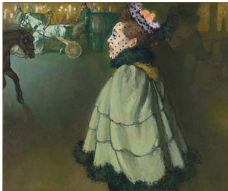
Vrouw op de Champs-Élysées bij nacht 1890-91. Louis Anquetin

Grootoudergezelschap opgericht dat inmiddels bestaat uit achttien enthousiaste grootouders, die gedurende tenminste vijf jaar 500 euro betalen waarmee zijzelf én hun kleinkinderen lid zijn. Met dit lidmaatschap en twee jaarlijkse ontvangsten voor grootouders met hun jonge familie helpt de grijze generatie om bij de jeugd een kiem te leggen voor interesse in alle mooie kunst die Nederlandse musea te bieden hebben. Op 2 mei was het gezelschap te gast bij de kindertentoonstelling MegaGrieken in het Rijksmuseum van Oudheden in Leiden. En op 21 november werd een ontvangst georganiseerd in het Mauritshuis, waarin de grootouders 'les' kregen hoe met hun kleinkinderen naar kunst te kijken.