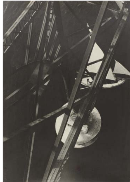
Gezicht vanaf de Pont transbordeur, Marseille 1929. László Moholy-Nagy