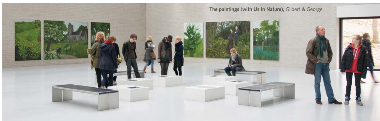
The paintings (with Us in Nature), Gilbert & George