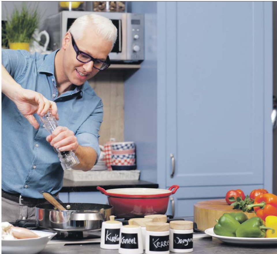
bereidt een maaltijd. 'Ik wil koken niet mystificeren maar juist verhelderen.'