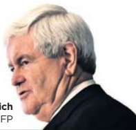
Newt Gingrich

De Britse band The Heavy is niet te spreken over de Republikeinse presidentskandidaat Newt Gingrich , die hun opzweepende nummer How You Like Me Now , gebruikt. Het nummer klinkt ook in veel tv-series en films.