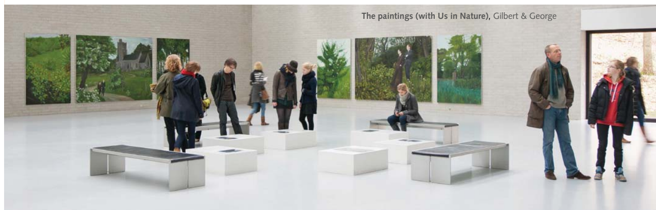
The paintings (with Us in Nature), Gilbert & George